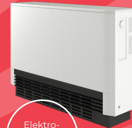
Elektro- speicher- heizung