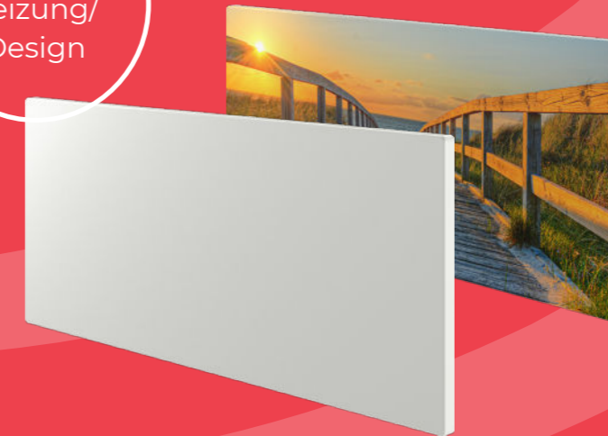
Infrarot- heizung/ Design